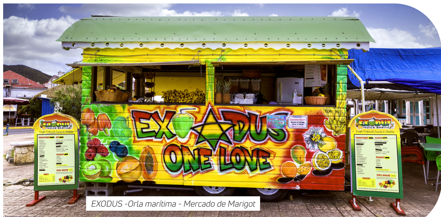
EXODUS -Orla marítima - Mercado de Marigot